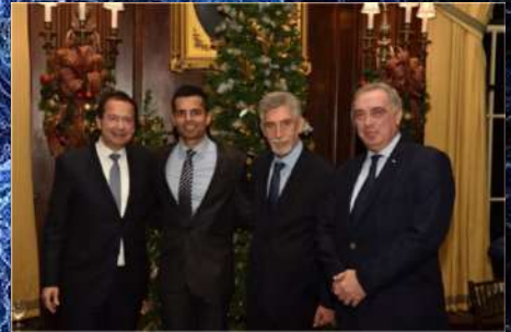
2019 Honoree: Mr. John Paulson, President of Paulson & Co Inc.. December 9, 2019