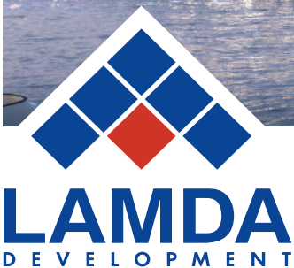
Riviera Tower - The Ellinikon