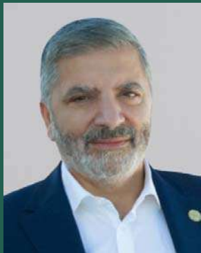
Γεώργιος Πατούλης Περιφερειάρχης Αττικής Πρόεδρος Ιατρικού Συλλόγου Αθηνών Πρόεδρος Εθνικού Διαδημοτικού Δικτύου Υγιών Πόλεων Προαγωγής Υγείας Πρόεδρος Διεθνούς Κέντρου Τουρισμού Υγείας Πρόεδρος Παγκόσμιου Ινστιτούτου Ελλήνων Ιατρών Πρόεδρος ΕΛΙΤΟΥΡ Α΄ Αντιπρόεδρος της Ένωσης Περιφερειών Ελλάδος

Σε μια εποχή που όλοι συζητάνε, σκέφτονται αλλά και πράττουν για την πράσινη ανάπτυξη, σε μια περίοδο που λόγω και της ενεργειακής κρίσης η πράσινη μετάβαση οφείλει να αλλάξει περιεχόμενο και σχήμα για να υπηρετήσει τους ίδιους σκοπούς, σε αυτή την στιγμή είναι μεγάλη ανάγκη να συζητήσουμε τον τρόπο με τον οποίο η πράσινη μετάβαση και η κυκλική οικονομία θα συνδεθούν οργανικά με την κοινωνική ευημερία, τη μείωση της φτώχειας και μια νέα ολοκληρωμένη αναπτυξιακή προοπτική για τη χώρα.