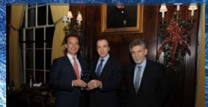
2012 Honoree: Andrew N. Liveris, Chairman and CEO of The Dow Chemical Company November 28, 2012