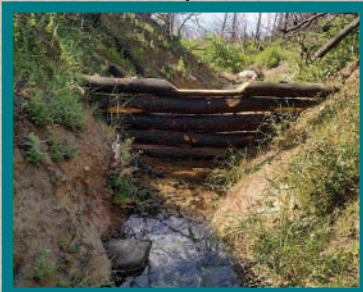
Αντιδιαβρωτικά & αντιπλημμυρικά έργα | Βαρυμπόμπη