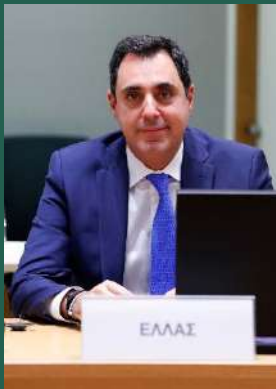
Ιωάννης Συμυρλής Γενικός Γραμματέας Διεθνών Οικονομικών Σχέσεων & Εξωστρέφειας Υπουργείο Εξωτερικών