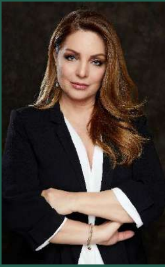
Άντζελα Γκερέκου Πρόεδρος ΕΟΤ

Το να μιλάμε για αειφόρα και βιώσιμη ανάπτυξη λίγο πολύ έχουμε όλοι καταλάβει την μεθοδολογία προς την υλοποίησή της.