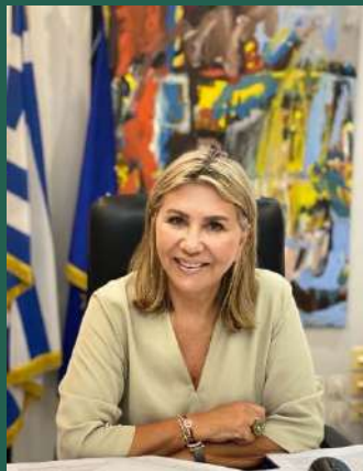
Ζέττα Μ. Μακρή Υφυπουργός Παιδείας & Θρησκευμάτων Υπουργείο Παιδείας & Θρησκευμάτων

Σε μια διαδραστική και εξελικτική πορεία, οι καθημερινές προκλήσεις θέτουν υψηλούς στόχους στη σχολική τάξη και στο εκπαιδευτικό σύστημα, γενικότερα, με κυριότερο την ολιστική και ενεργητική μάθηση μέσα από καινοτόμα προγράμματα διδασκαλίας και την ανάγκη καλλιέργειας νέων δεξιοτήτων. Στο κέντρο του ενδιαφέροντός μας, ο θεσμός της καινοτόμου επιχειρηματικότητας προωθεί σύγχρονες ιδέες σε μια διαδικασία ανοιχτή, χωρίς περιορισμούς και αποκλεισμούς, με το βλέμμα στραμμένο στη βιώσιμη ανάπτυξη και το μέλλον.