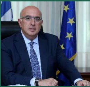
Μιχάλης Παπαδόπουλος Υφυπουργός Υποδομών και Μεταφορών Αρμόδιος για τις Μεταφορές Υπουργείο Υποδομών και Μεταφορών