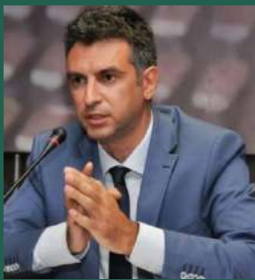
Δημήτρης Σκάλκος Γενικός Γραμματέας Δημοσίων Επενδύσεων και ΕΣΠΑ Υπουργείο Ανάπτυξης και Επενδύσεων