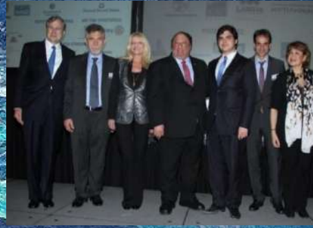
2014 Honoree: John Catsimatidis , Chairman & CEO, Red Apple Group