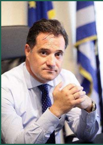
Άδωνις Γεωργιάδης Υπουργός Ανάπτυξης & Επενδύσεων Υπουργείο Ανάπτυξης & Επενδύσεων

Μέσω της Βιωσιμότητας, λοιπόν, η Ελλάδα αναβαθμίζει ακόμη περισσότερο τον Γεωπολιτικό της ρόλο και προς αυτήν την κατεύθυνση τα αποτελέσματα είναι ήδη πάρα πολύ σημαντικά και θα είναι ακόμη σημαντικότερα στο μέλλον.