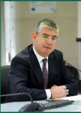
Γιάννης Τσακίρης Υφυπουργός Ανάπτυξης και Επενδύσεων, Δημόσιες Επενδύσεις και ΕΣΠΑ Υπουργείο Ανάπτυξης & Επενδύσεων

«Δεν υπάρχει κάτι πιο δυνατό σ' αυτό τον κόσμο από μια ιδέα για την οποία έχει έρθει η ώρα να πραγματοποιηθεί», έλεγε ο Βίκτωρ Ουγκό . Σε αυτή ακριβώς τη φράση συνοψίζεται η πρόθεση της ελληνικής κυβέρνησης αλλά και της Ευρωπαϊκής Ένωσης σε σχέση με τα επόμενα βήματα που διατίθενται να κάνουν για τη βιώσιμη αντιμετώπιση της ενεργειακής κρίσης, δημιουργώντας ταυτόχρονα τις προϋποθέσεις για μια βιώσιμη ανάπτυξη στη χώρα μας λαμβάνοντας υπόψη τις συστάσεις της Ευρωπαϊκής Επιτροπής αλλά και τους στόχους Βιώσιμης Ανάπτυξης του ΟΗΕ.