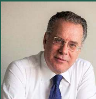
Γιώργος Κουμουτσάκος Βουλευτής Β1 Βόρειου Τομέα Αθηνών με τη Νέα Δημοκρατία τ. Αναπληρωτής Υπουργός Μετανάστευσης και Ασύλου τ. Αναπληρωτής Υπουργός Προστασίας του Πολίτη