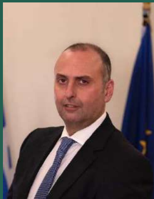
Γιώργος Καραγιάννης Υφυπουργός Υποδομών Υπουργείο Υποδομών και Μεταφορών

Η προοδευτική ατζέντα της κυβέρνησης και του Πρωθυπουργού Κυριάκου Μητσοτάκη επέβαλαν, πολύ πριν διαφανεί η μεγάλη ενεργειακή κρίση, τη στροφή και την αξιολόγηση της πολιτικής μας υπό το πρίσμα της βιωσιμότητας και της εξοικονόμησης προς όφελος της ασφάλειας, της αυτονομίας και εν τέλει του περιβάλλοντος και των πολιτών.