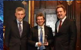
2017 Honoree: Mr. André Calantzopoulos, CEO of Philip Morris International December 11, 2017