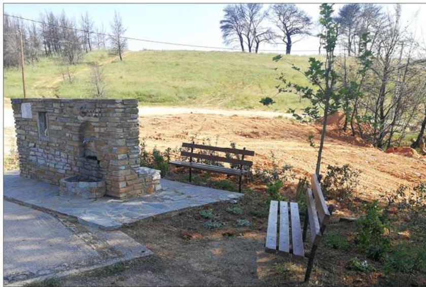
Περιοχή Δροσοπηγής μετά την αποκατάσταση