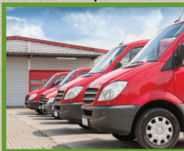
Επιχειρησιακός εξοπλισμός | Πυροσβεστικό Σώμα Ελλάδος