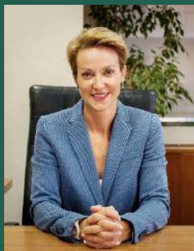
Αλεξάνδρα Σδούκου Γενική Γραμματέας Ενέργειας και Ορυκτών Πρώτων Υλών Υπουργείο Ενέργειας & Περιβάλλοντος

Τα γεγονότα του τελευταίου έτους στο χώρο της ενέργειας ανασχημάτισαν τη γεωμετρία της διεθνούς αγοράς, διατάραξαν βαθιά τα ενεργειακά συστήματα στην Ευρώπη και πυροδότησαν ανεπιθύμητες παρενέργειες στην οικονομία. Μια από τις συνιστώσες αυτής της διαταραχής είναι το πρόβλημα που δημιουργεί η εξάρτηση του ενεργειακού μας συστήματος από το φυσικό αέριο, σε συνδυασμό με την εκτόξευση των τιμών του ορυκτού. Η Κυβέρνηση και το Υπουργείο Περιβάλλοντος και Ενέργειας ειδικότερα, εργαζόμαστε πυρετωδώς για να αντιμετωπίσουμε το πρόβλημα και έχουμε προσανατολιστεί σε μια σειρά στόχων, βραχυπρόθεσμων και μακροπρόθεσμων.