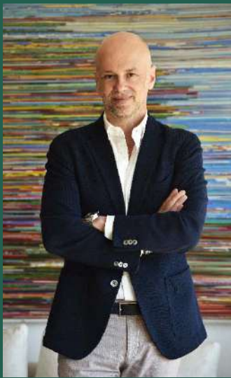
Γιάννης Ρέτσος Πρόεδρος ΣΕΤΕ

Με μεγάλη χαρά χαιρετίζω την πρωτοβουλία της Capital Link να εκκινήσει, στο πλαίσιο του φετινού Sustainability Forum, διάλογο για τη σύνδεση της βιώσιμης ανάπτυξης με τις γεωπολιτικές προκλήσεις.