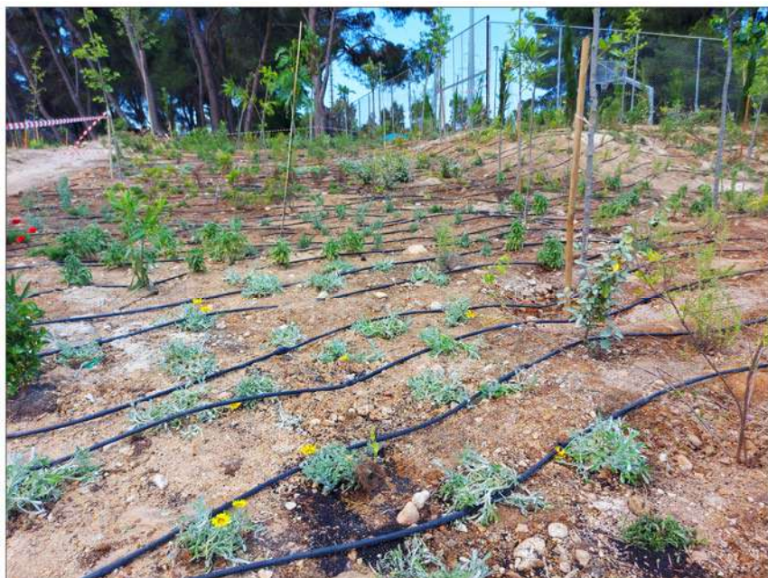
Περιοχή Κρυονερίου μετά την αποκατάσταση