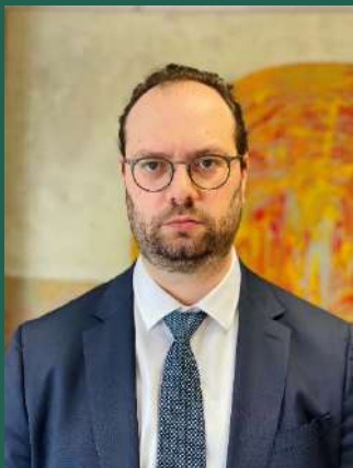
Ορέστηs Καβαλάκης Γενικός Γραμματέας Ιδιωτικών Επενδύσεων και ΣΔΙΤ Υπουργείο Ανάπτυξης & Επενδύσεων

Οι μεταρρυθμίσεις που ψηφίσθηκαν με λίγους μήνες διαφορά και αφορούν το θεσμικό πλαίσιο των στρατηγικών (ν. 4864/2021) και ιδιωτικών (ν. 4887/2022) επενδύσεων θέτουν ένα σύγχρονο και συνεκτικό πλαίσιο υλοποίησης επενδυτικών σχεδίων και προσέλκυσης ξένων κεφαλαίων. Οι στοχεύσεις του Υπουργείου Ανάπτυξης και Επενδύσεων κατά το στάδιο σχεδιασμού των εν λόγω νομοθετημάτων σχετίζονταν με την βελτίωση του επενδυτικού περιβάλλοντος στη χώρα μας και την ανάγκη για επιτάχυνση και ευελιξία των προβλεπόμενων διοικητικών διαδικασιών για τις στρατηγικές και ιδιωτικές επενδύσεις, προκειμένου να αντιμετωπιστούν υφιστάμενα προβλήματα.