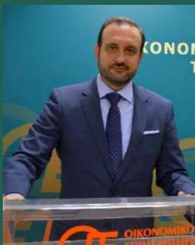
Κωνσταντίνος Β. Κόλλιας Πρόεδρος Οικονομικό Επιμελητήριο Ελλάδος

Βιώνουμε μια νέα πραγματικότητα. Μια νέα πραγματικότητα, η οποία έχει προκύψει όχι μόνο από τις συνθήκες, που δημιούργησε η πανδημία.