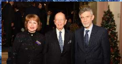
2016 Honoree: Mr. Wilbur L. Ross, Chairman and Chief Strategy Officer of WL Ross & Co. December 12, 2016