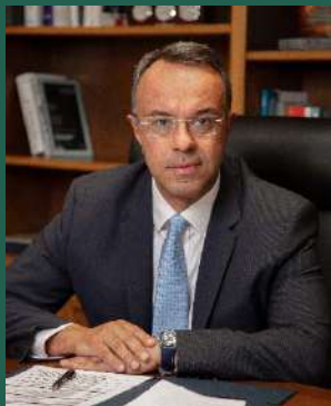
Χρήστος Σταϊκούρας Υπουργός Οικονομικών Υπουργείο Οικονομικών

Σήμερα η κλιματική αλλαγή δεν αποτελεί πρόβλεψη, αλλά πραγματικότητα: οι φυσικές καταστροφές που αυξανόμενα αντιμετωπίζει ο πλανήτης συνιστούν ξεκάθαρο κάλεσμα για δράση και επανασχεδιασμό. Παράλληλα, στο πλαίσιο της μακράς περιόδου παγκόσμιας αβεβαιότητας που διανύουμε – από την εξάπλωση της παγκόσμιας πανδημίας έως το πιο πρόσφατο ξέσπασμα γεωπολιτικών εντάσεων και κρίσης στον ενεργειακό τομέα – η επιδίωξη για κλιματική και περιβαλλοντική βιωσιμότητα παραμένει στο επίκεντρο της διεθνούς πολιτικής ατζέντας.