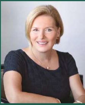
Μίνα Γκάκα Αναπληρώτρια Υπουργός Υγείας Υπουργείο Υγείας

Όλοι θέλουμε ένα σύστημα υγείας που ανταποκρίνεται στις ανάγκες και τις επιθυμίες των Ελλήνων πολιτών, των ασθενών και φυσικά των εργαζομένων στις δομές υγείας, που δημιουργεί σε όλους εμπιστοσύνη και ασφάλεια. Το ΕΣΥ αποδυναμώθηκε στα χρόνια της κρίσης, που ταλάνισαν την ελληνική οικονομία και την κοινωνία. Χρειάστηκε στήριξη, την οποία παρείχαμε σαν Κυβέρνηση και Υπουργείο, παρά την πίεση λόγω της πανδημίας. Πέρα από την πανδημία και την ανάγκη να λυθούν έκτακτες ανάγκες, η οργάνωση του συστήματος είχε μείνει στο ΕΣΥ που δημιουργήθηκε πριν 40 χρόνια. Πλέον, έχουν μεταβληθεί οι ανάγκες, οι τεχνολογίες, η έρευνα στην ιατρική, ενώ η ψηφιοποίηση μπήκε για τα καλά στη ζωή μας.