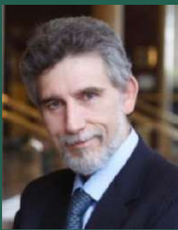
Νίκος Μπορνόζης Πρόεδρος Capital Link Inc.