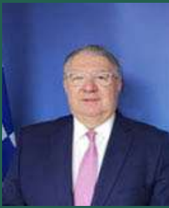
Ομότ. Καθ. Ιωάννης Χρυσουλάκης Γενικός Γραμματέας Απόδημου Ελληνισμού και Δημόσιας Διπλωματίας