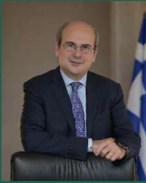
Κωστής Χατζηδάκης Υπουργός Εργασίας και Κοινωνικών Υποθέσεων Υπουργείο Εργασίας και Κοινωνικών Υποθέσεων

Η πλήρης, παραγωγική και αξιοπρεπής απασχόληση ανήκει στους στόχους βιώσιμης ανάπτυξης των Ηνωμένων Εθνών για το 2030. Είναι στόχος ο οποίος, με τις προκλήσεις που βιώνει ο πλανήτης μας- την κλιματική αλλαγή, την πανδημία, την ενεργειακή κρίση, τον πληθωρισμό- γίνεται ακόμη πιο επιτακτικό να επιτευχθεί. Στην Ελλάδα, παρά τις δυσκολίες που δημιουργούν και σε εμάς οι διεθνείς αυτές προκλήσεις, τα έχουμε ως τώρα πάει καλά: Έχουμε περιορίσει το σημαντικότερο πρόβλημα της ελληνικής αγοράς εργασίας, την ανεργία, από το 17,3% που την παραλάβαμε το καλοκαίρι του 2019, στο 11,4% τον περασμένο Ιούλιο, σύμφωνα με τα στοιχεία της Eurostat. Στο ίδιο διάστημα, περισσότερες από 200.000 νέες θέσεις εργασίας προστέθηκαν στην αγορά εργασίας!