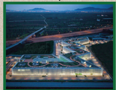
Καινοτόμο βιοκλιματικό κτήριο | Karela Office Park - Παιανία