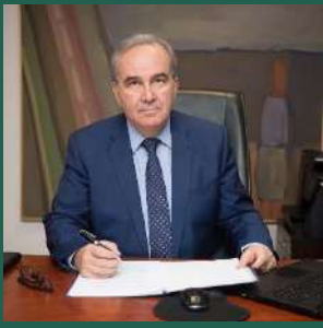
Νίκος Παπαθανάσης Αναπληρωτής Υπουργός Ανάπτυξης και Επενδύσεων Υπουργείο Ανάπτυξης & Επενδύσεων

Οι νομοθετικές πρωτοβουλίες, οι συνεχείς μεταρρυθμιστικές παρεμβάσεις και η ταχεία αποκατάσταση συστημικών παθογενειών δεκαετιών, μόλις σε τρία χρόνια από την κυβέρνησή μας, συνιστούν ένα πρωτόγνωρο επενδυτικό - επιχειρηματικό περιβάλλον στη χώρα. Η ανάπτυξη, η καινοτομία, η επένδυση στο ταλέντο και τις γνώσεις των νέων ανθρώπων προς όφελος της νέας επιχειρηματικότητας και της μετατροπής της Ελλάδας σε έναν από τους πιο ελκυστικούς επενδυτικούς προορισμούς της Ευρώπης, αποτυπώνονται πλέον στην καθημερινότητα της οικονομίας παρά το διεθνές περιβάλλον των πολυποίκιλων κρίσεων και της γενικευμένης αβεβαιότητας.